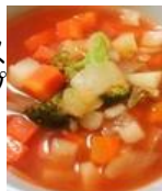
デトックス 野菜スープ