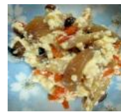
人参としめじ の白和え