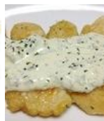
ささ身の チキン南蛮