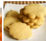
ココナッツ オイルクッキー