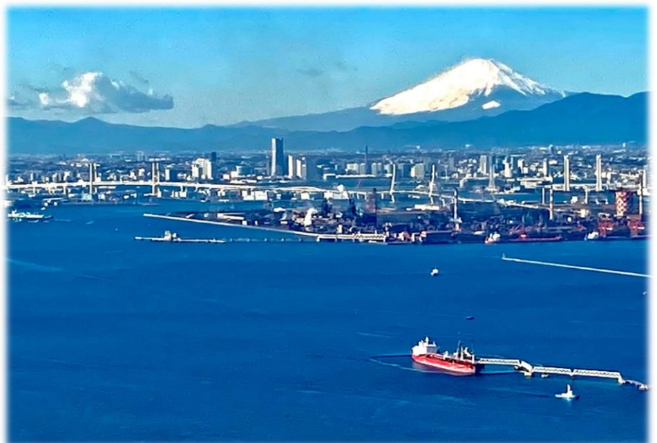
富嶽三十七景 羽田沖浪静